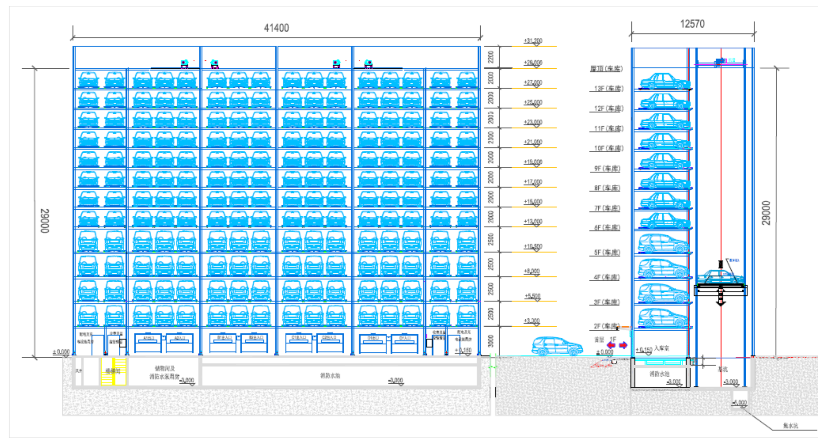
车库立面方案图（单位：mm）