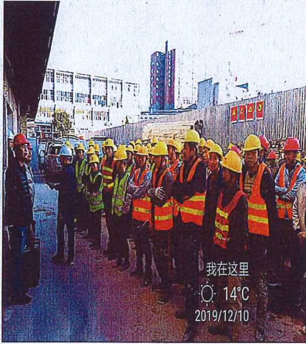
项目部组织工人加强安全教育