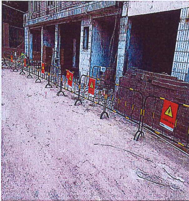
施工现场靠近外墙危险区域已安全防护隔离