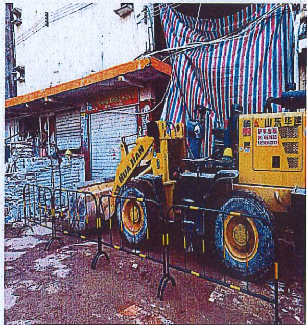
人行道施工区域封闭，禁止通行