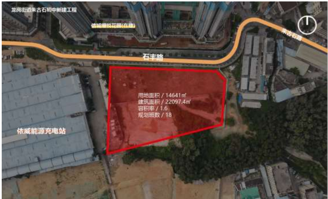
用地现状与周边交通图

现状为空地，场地平整，仅北侧有一条道路通行。西侧与东侧为现状工业区，北侧为更新单元一期已建设居住区。用地西侧、南侧、北侧均规划为二类居住用地，建筑限高 100m。场地内有乔木若干，在建设前需进行拆除和树木迁移。场地东侧现状为林地，规划为公园绿地，南侧现状有一条东西向水系，依据更新规划将会南移至连心路北侧。周边 1000m 范围内有大面积山体，生态景观资源优越。