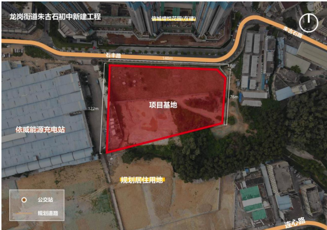
用地现状与周边交通图