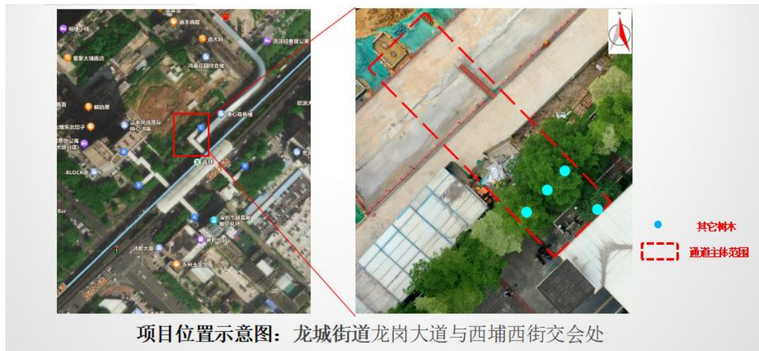
项目位置示意图：龙城街道龙岗大道与西埔西街交会处